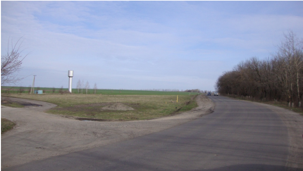
Фотография Сторона Б (существующее положение)