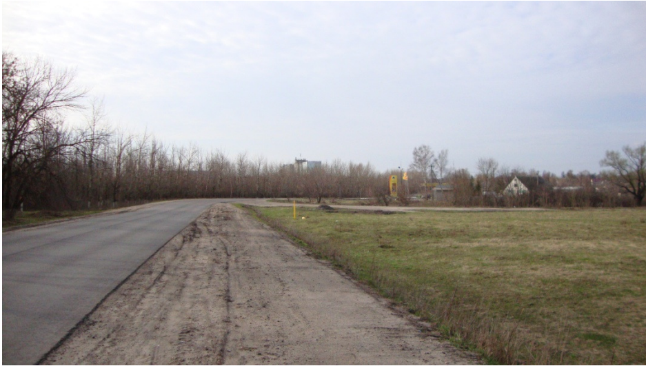
Фотография Сторона А (существующее положение)