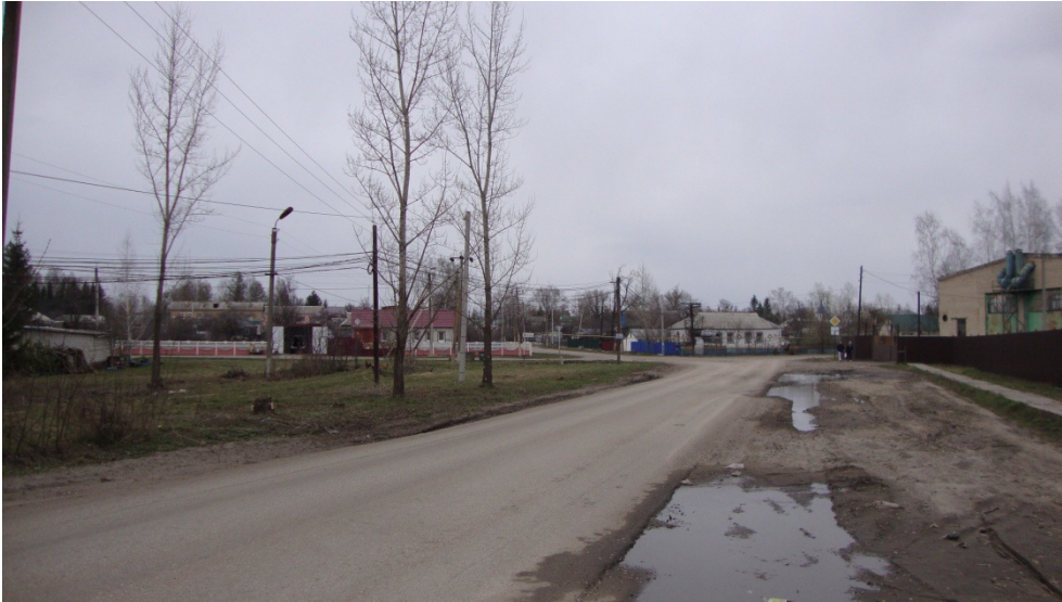
Фотография Сторона Б (существующее положение)