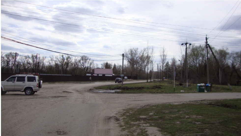
Фотография Сторона А (существующее положение)