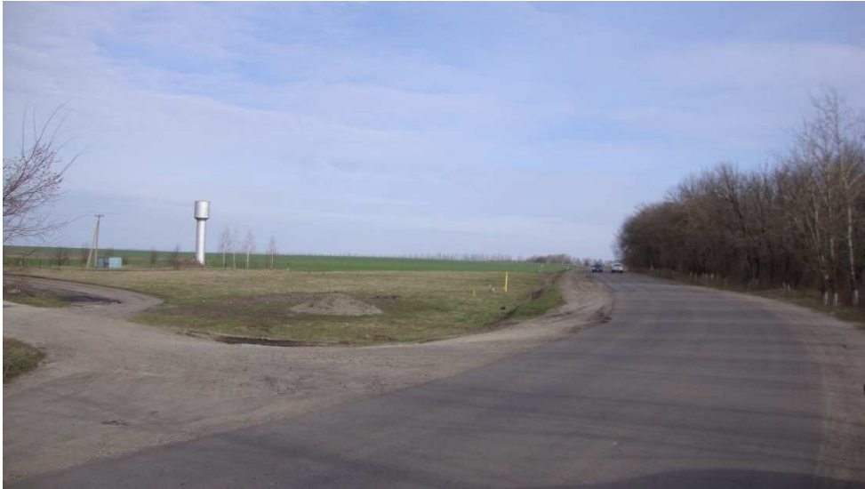
Фотография Сторона Б (существующее положение)