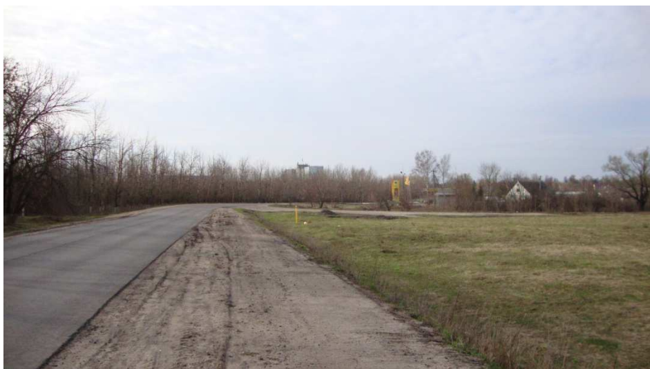
Фотография Сторона А (существующее положение)