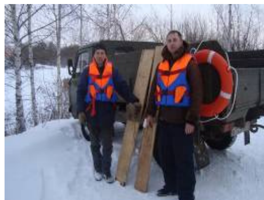
Спасательные средства, применяемые зимой